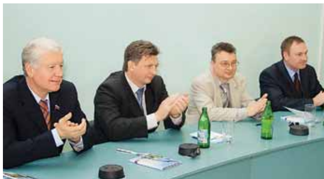
Н.И. Кабачек , главный врач ГУЗ АМОКБ, В.Г. Акишкин , министр здравоохранения Астраханской области, С.Е. Кузьмин , председатель профсоюза медицинских работников, А.В. Буркин , первый заместитель министра здравоохранения