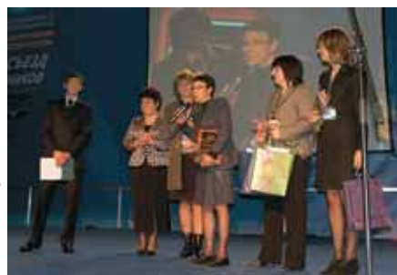
Благодарность за сотрудничество в адрес зарубежных коллег из Канады и США