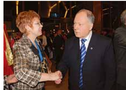
Лауреатов премии «Профессия — Жизнь» поздравляли представители Госдумы, Минздравсоцразвития РФ, общественных организаций