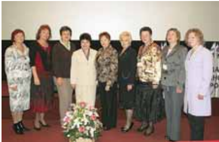
Члены Правления РАМС